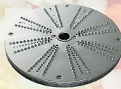
tarcia twardego sera