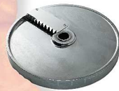
słupków i pałeczek

* Wszystkie ceny podane w Promocji są cenami netto PLN